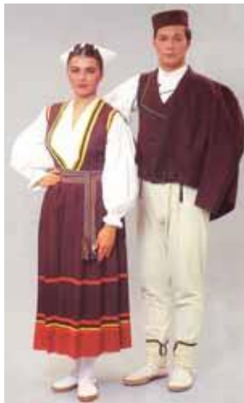
➤ Poljička nošnja