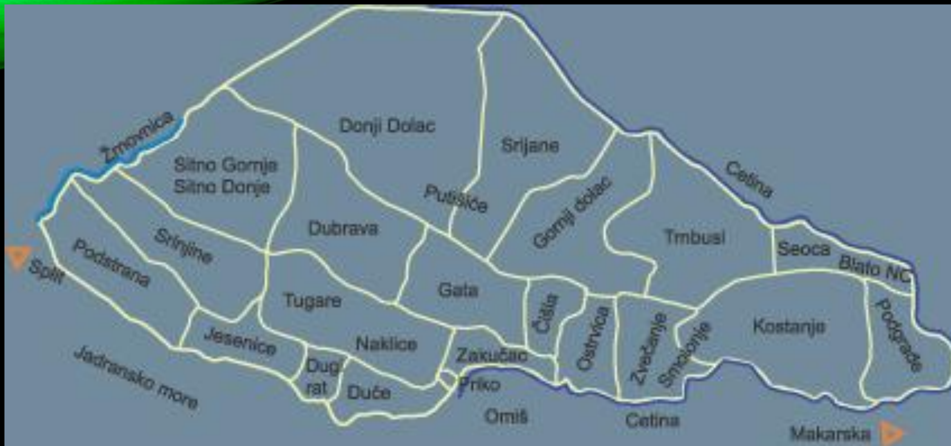
Slika prikazuje mjesta koja čine Poljica